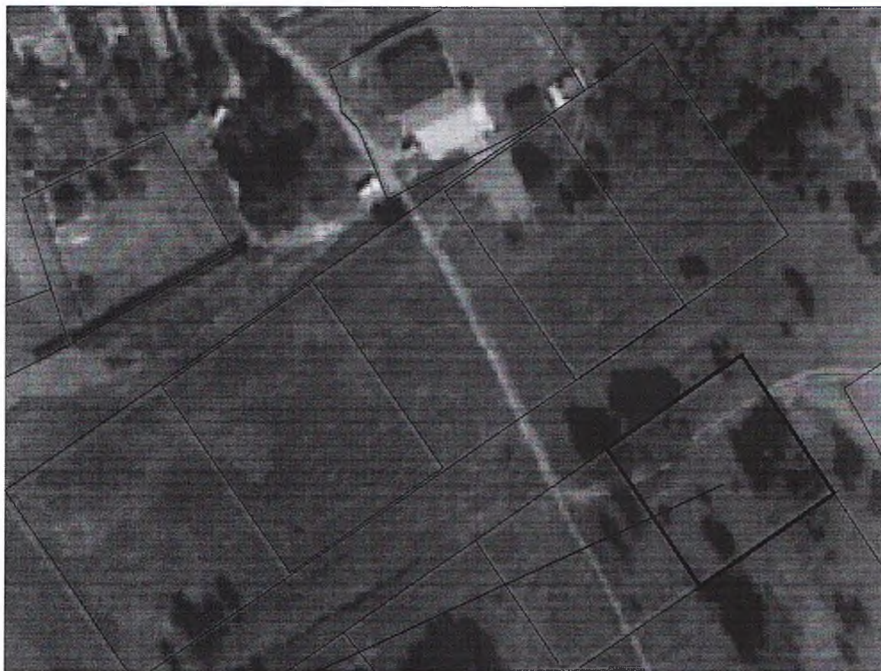
Схема расположения земельного участка в окружении смежно расположенных земельных участков (Ситуационный план)