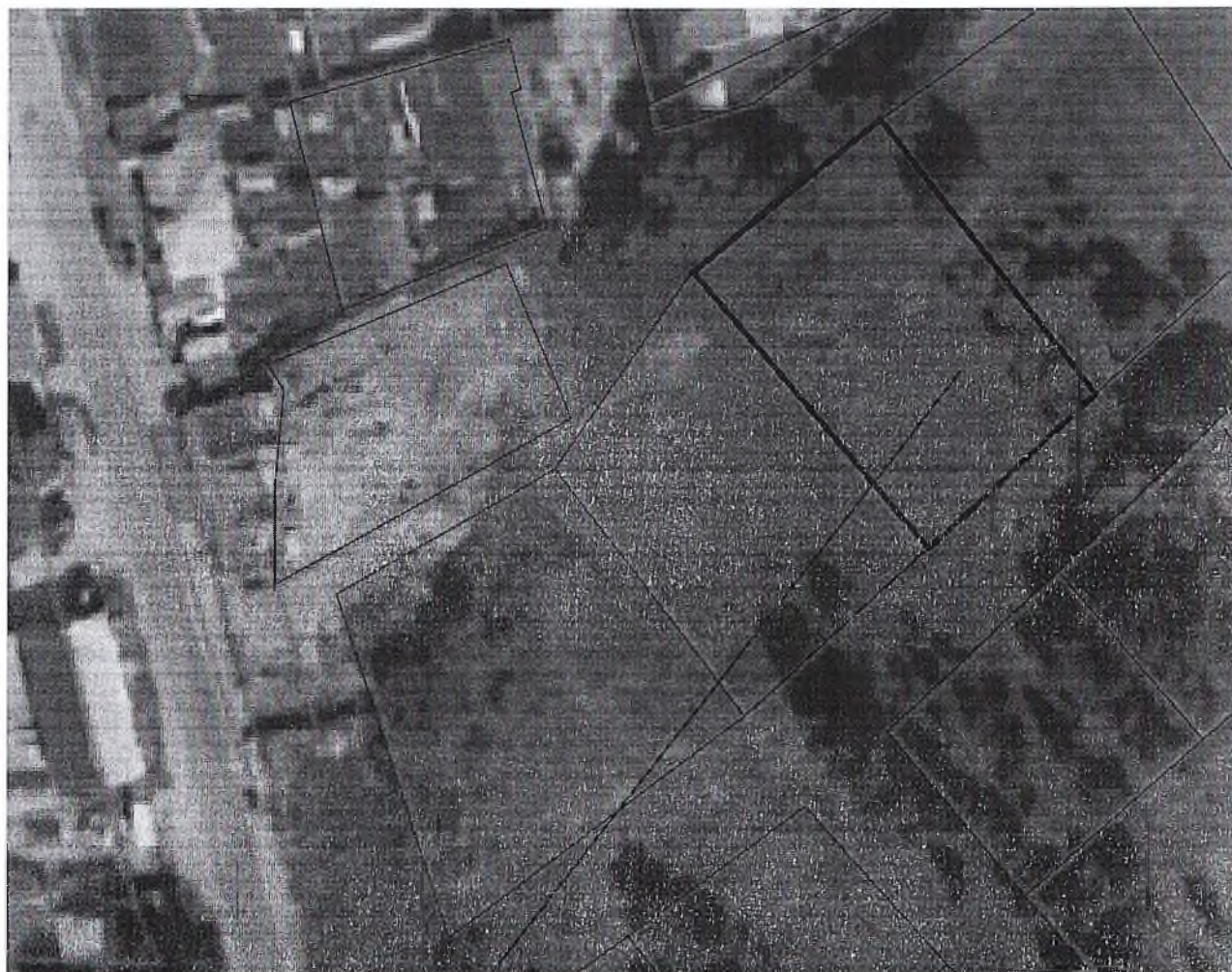
Схема расположения земельного участка в окружении смежно расположенных земельных участков (Ситуационный план)