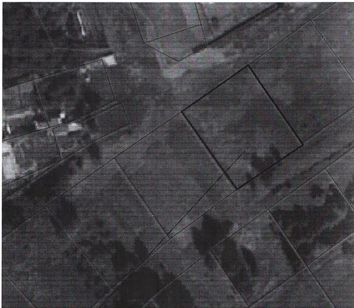
Схема расположения земельного участка в окружении смежно расположенных земельных участков (Ситуационный план)