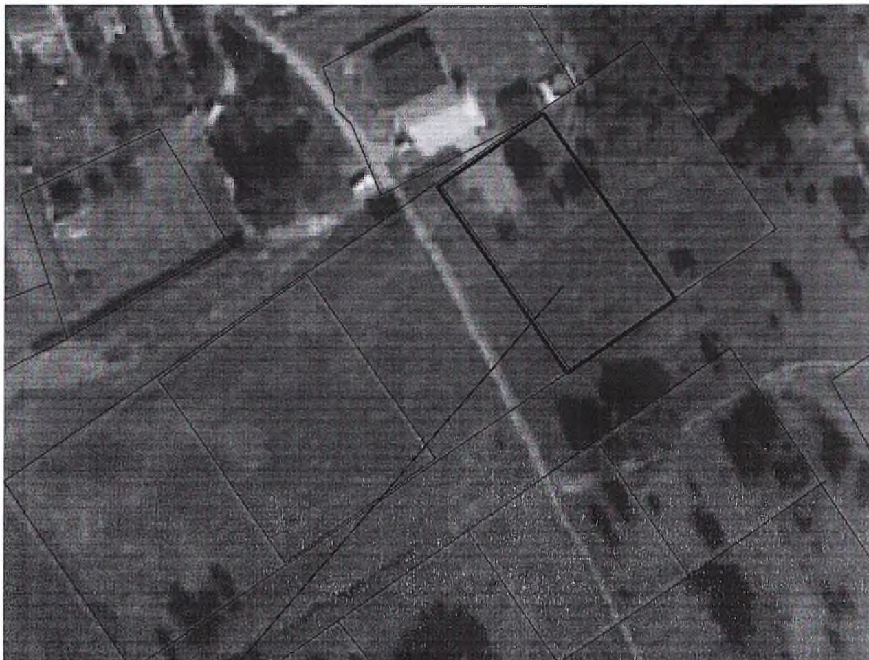
Схема расположения земельного участка в окружении смежно расположенных земельных участков (Ситуационный план)