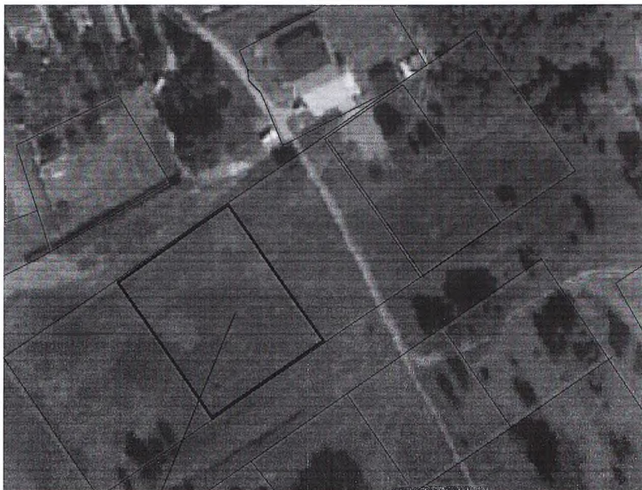
Схема расположения земельного участка в окружении смежно расположенных земельных участков (Ситуационный план)